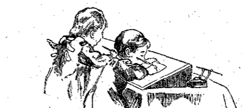
ΑΛΛΗΛΟΓΡΑΦΙΑ ΤΗΣ «ΔΙΑΠΛΑΣΕΩΣ»